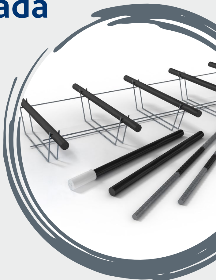
Support pour goujons Strada DH22, S235 hauteur 110 mm, écartement des goujons 500 mm N° d'art. 050.603.100