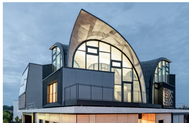
Bei diesem Konstruktionsprinzip sind komplexe geschwungene Formen und filigrane Bauteilstärken möglich. © ROK Architekten

Für die Bauwirtschaft ist das HiLo-Dach als Prototyp interessant, denn es demonstriert sowohl die Praxistauglichkeit als auch die Effizienz des flexiblen Schalungssystems. Der Materialverbrauch reduziert sich deutlich