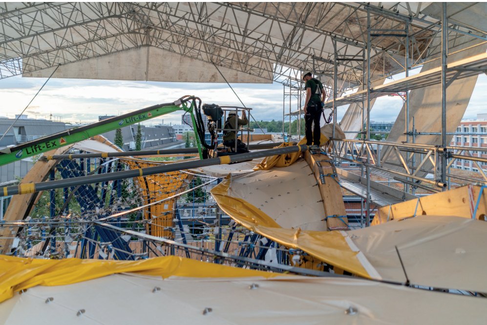
Die textile Polymer-Plane wird als Schalung aufgelegt.

lungen haben könnten. Die Schalung des HiLo-Dachs ist ein flexibles System. Jede Phase – jede Schicht – hat ihre Aufgabe und ist auf die anderen Phasen abgestimmt in Grösse, Bauweise, Design usw. Ist der Beton einmal hart, ist das Dach fertig und es sind keine Änderungen mehr möglich.