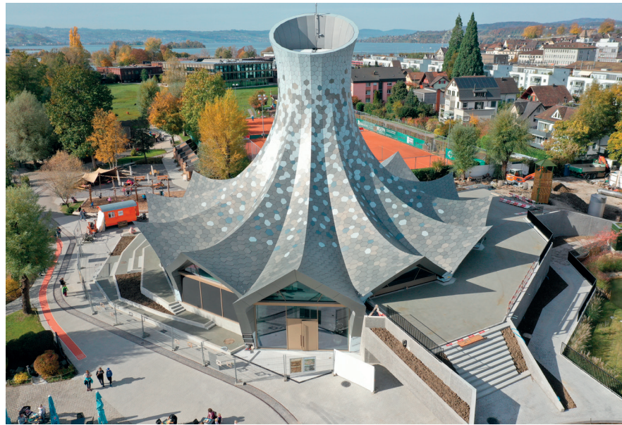
Des événements au lieu d'otaries : le chapeau de magicien remplace l'arène aux otaries du zoo pour enfants Knie de Rapperswil. Ce bâtiment à l'architecture originale ouvrira ses portes en début de saison au printemps 2021.